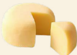
蒜山ジャージー ゴダチーズ 200g 1,120円