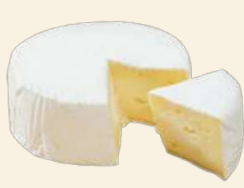
蒜山ジャージー カマンベールチーズ 125g 1,000円