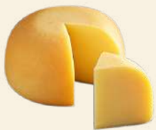
蒜山ジャージー スモークチーズ 200g 1,170円